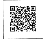
予約 QR コード

右記 QR コードを読みとり、「 社会人講座予約フォーム 」よりご予約ください。 当日及び翌日の 9 : 00 ~ 11 : 00 のご予約はお電話にてお願いいたします。